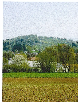
vizura na pobočje Cerovcev na desnem bregu Krke