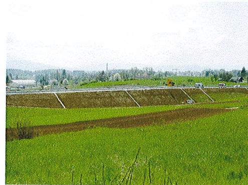
deviacija D 1-12