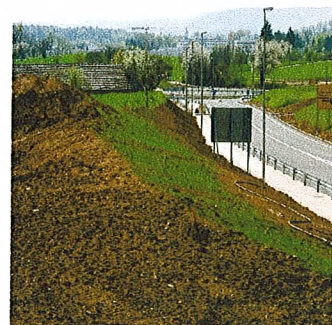
pogled na prostor novega "vhoda v mesto"