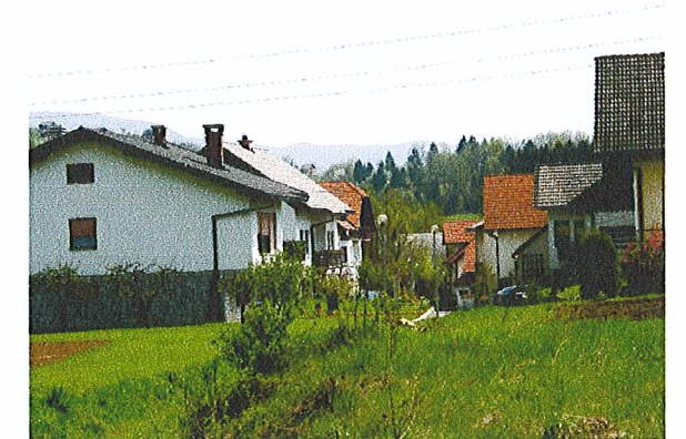
gosto strnjeno naselje Pod Trško goro

Stopnja izkoriščenosti zemljišča za gradnjo je bila v skladu z Uredbo o prostorskem redu (Uradni list RS št. 122/04) računana kot faktor zazidanosti gradbene parcele (z), ki je definiran kot razmerje med zazidano površino in celotno površino gradbene parcele. Opozoriti je potrebno, da ni bil računana na površino posamezne gradbene parcele, pač pa na površino območja posamezne namenske rabe (analiza dejanske rabe prostora). To je tudi eden od razlogov, da so vrednosti nižje od priporočenih.