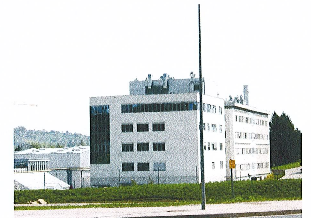
območje tovarne zdravil Krka (faktor zazidljivosti ni merodajen)