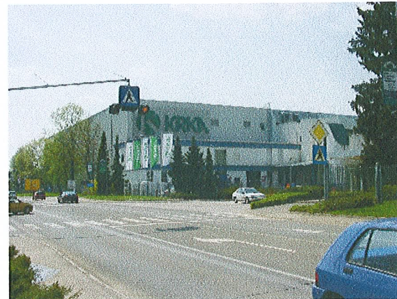
poslovni vhod v tovarno