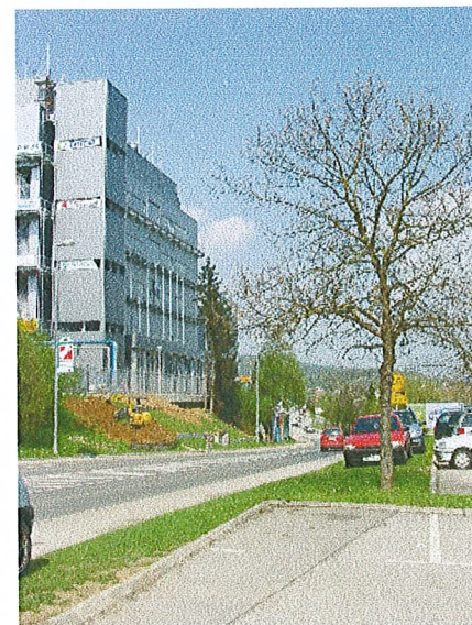
nov objekt tovarne ob Šmarješki cesti

Na območju III/cona Ločna so identificirane predvsem potrebe tovarne zdravil KRKA , v Projektni nalogi za pripravo OLN poslovno storitvena cona Mačkovec – 1, št. 353-07-4/2005-1901, MONM, september 2005, je navedeno: »večji del zahodnega dela območja bo predvidoma namenjen širitvi tovarne zdravil.«