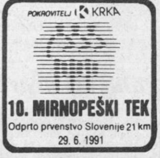
10. MIRNOPEŠKI TEK Odprto prvenstvo Slovenije 21 km 29. 6. 1991

v izredno kožljivem trenutku jugoslovanskega dogajanja, ni po Goebbelsovih besedah nikakršno naključje, dvanajstera, ki sporazumoma pripisuje ne le gospodarski, temveč tudi politični pomen, ni zadnje čase varčevala s prizadevanji, da Jugoslovane opozori na prednosti, ki bi jih imeli pri sodelovanju s skupnostjo, če bi ostali skupaj. V ta kontekst sodijo nedavni Delorsovi in Santerjev obisk v Beogradu, akcija podpore enotni, demokratični in mirni poti za jugoslovanski razplet, spoštovanju človekovih pravic pri nas in gospodarskim