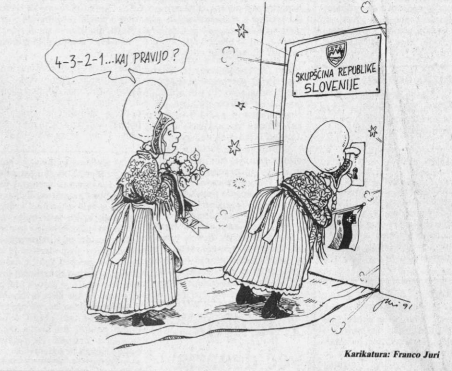
Karikatura: Franco Juri