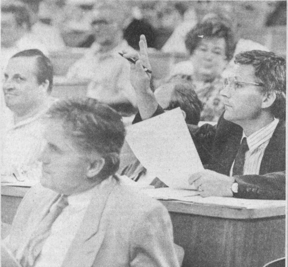
PREDZADNJE DEJANJE - Republiški parlament je opravil vse potrebno za razglasitev samostojnosti Slovenije.